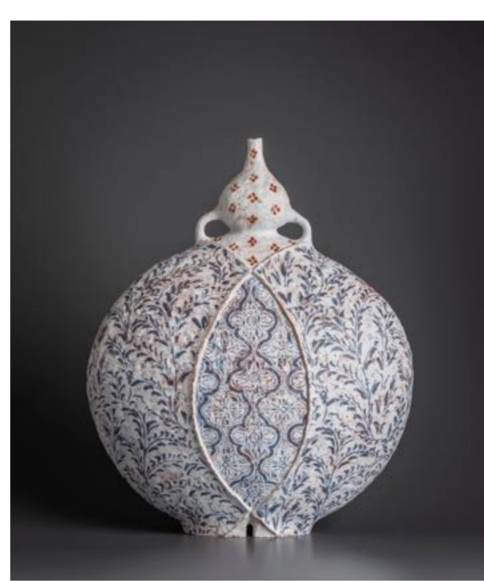
Arieta VIII 2019 41x33x15cm