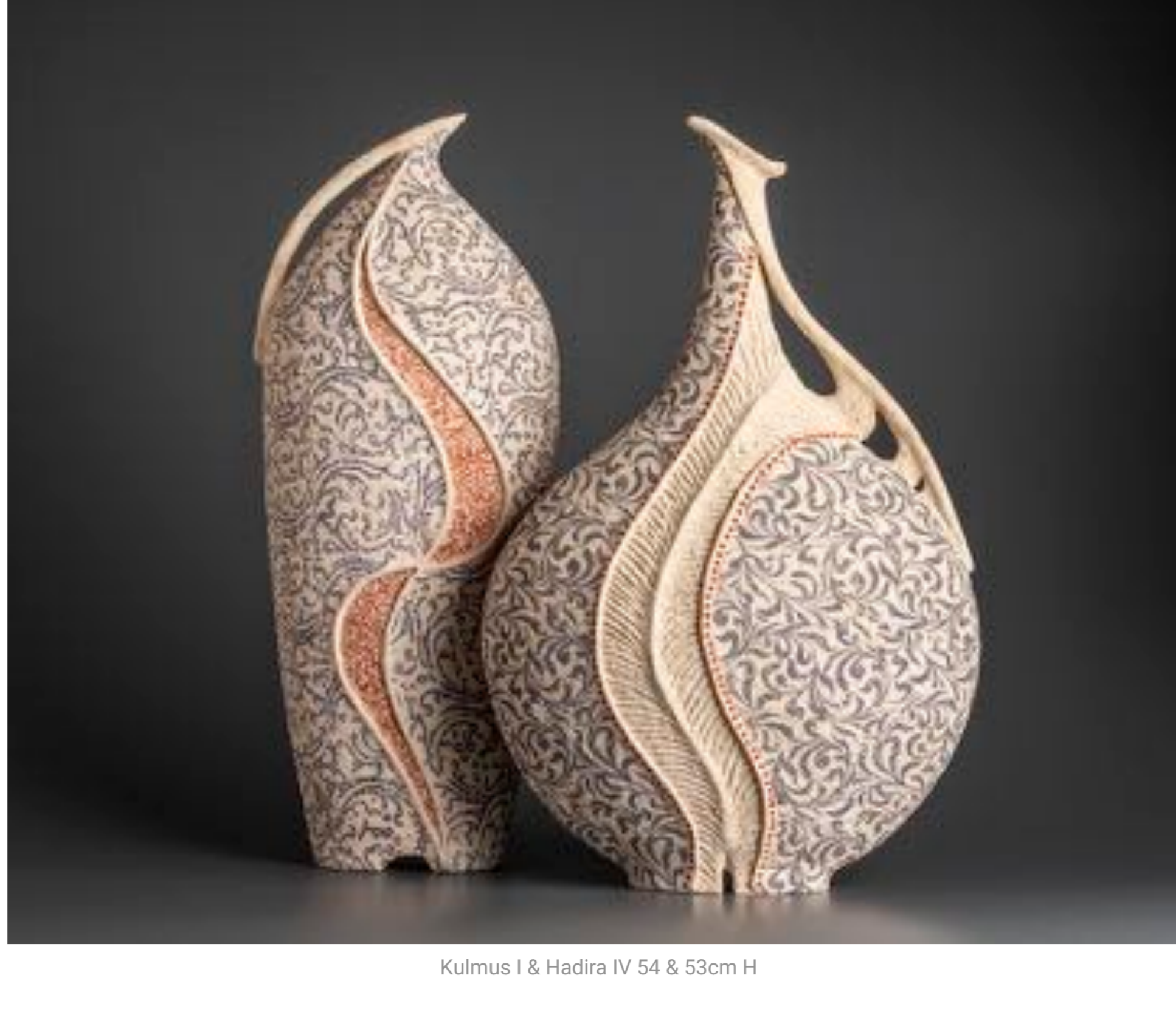
Kulmus I & Hadira IV 54 & 53cm H

La cerámica, el vidrio y la caligrafía antigua, emplean principios estéticos universales que curiosamente también revelan aspectos íntimos de las idiosincrasias y necesidades humanas. Por eso, al vivir en Australia y poder absorber las influencias del paisaje y la luz, Avital Sheffer es capaz de ofrecer una perspectiva única, desde la que revaloriza su compleja herencia y la transforma en alfarería y conocimiento.