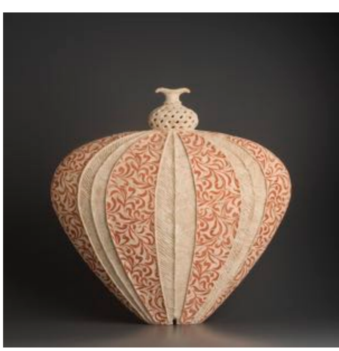
Neuma II 2018 53x54x21 cm

Al ser un país de inmigración masiva va llegando nuevo conocimiento, tradiciones, estilos y técnicas con los migrantes y sobre todo, dilemas y temas históricos, políticos y sociales. En general se percibe aquí el multiculturalismo como un tremendo recurso enriquecedor, así que la cerámica disfruta de estado de renovación continua y de la atención del público. Además, tenemos excelentes colegios y asociaciones, congresos y conferencias. Es buen lugar para la practica de la cerámica, la única desventaja es la distancia geográfica que hace muy caro el envío de obras al resto del mundo.