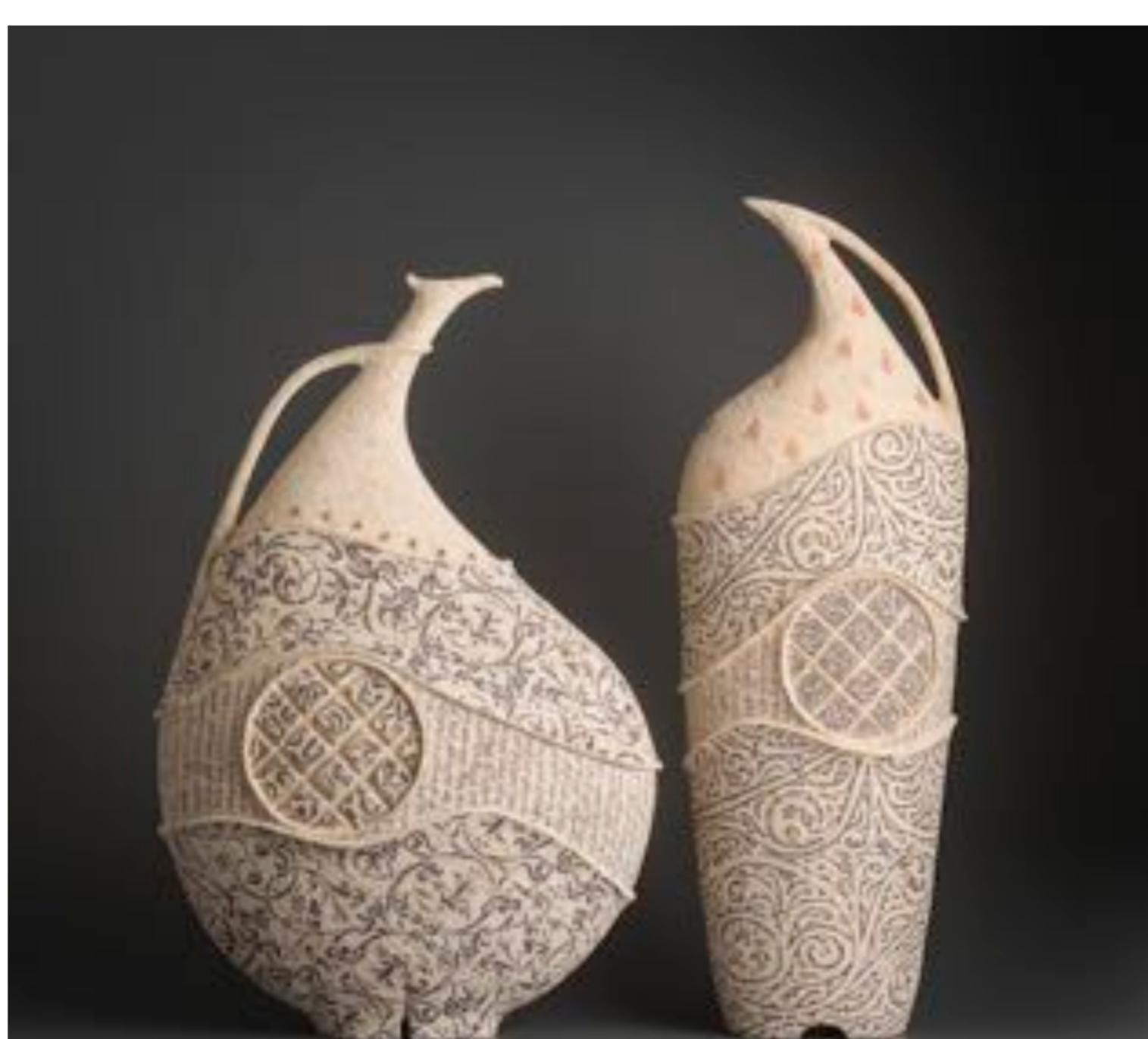
Aldaba III 2017 59x39x19 cm & Sentinel VII 2017 65x23x16 cm

Asimismo, la Edad de Oro del Islam. Los moriscos sabían convivir, sintetizar conocimientos e intercambiar con otras culturas así que a la vez era la Edad de Oro del judaísmo. Una época fértil cuando el arte, las ciencias, la filosofía, la poesía se bailaban