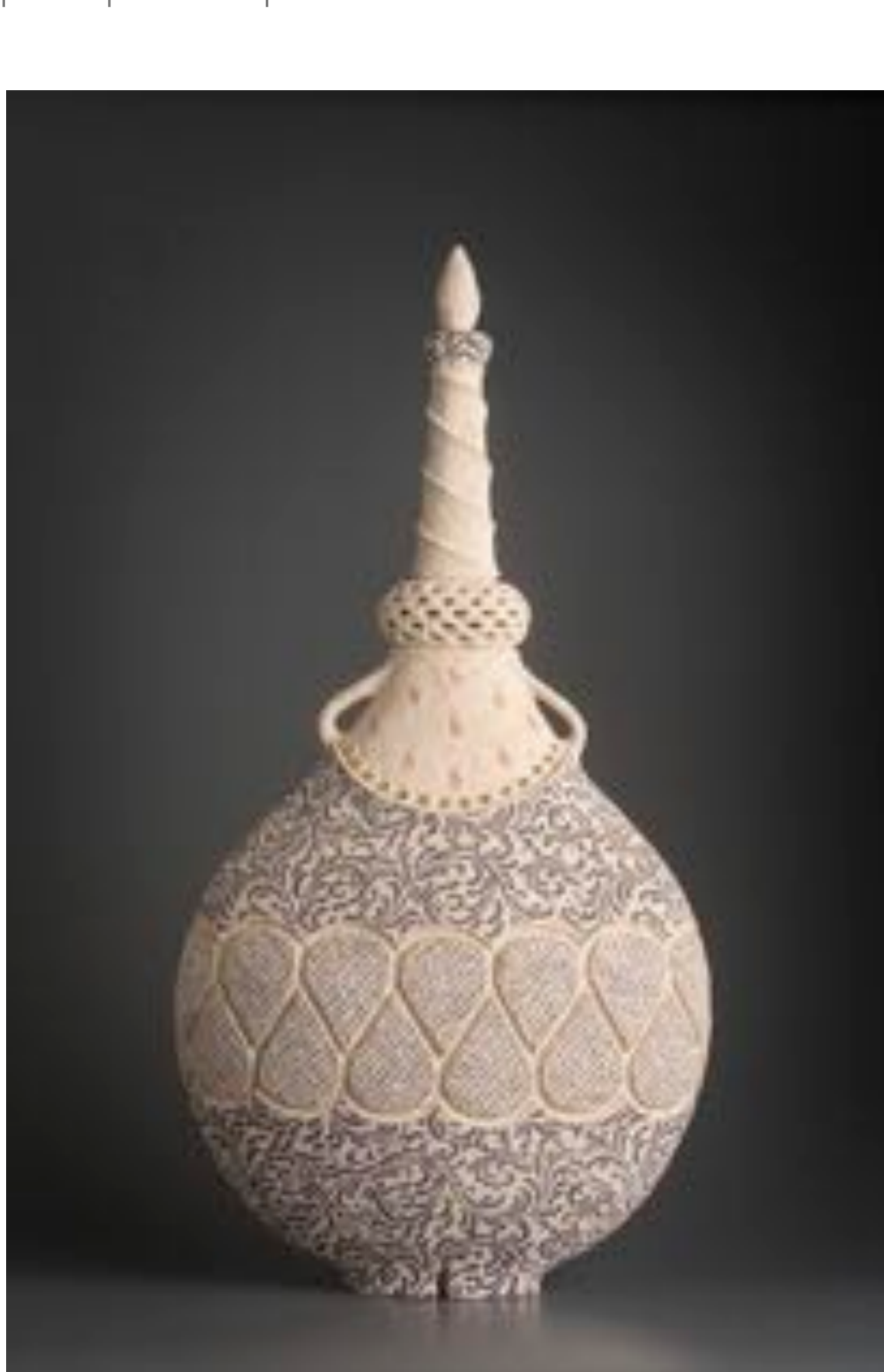
La Mela II 2017 75x39x18 cm

Desde el principio quería hacer vasijas con las técnicas de construcción a mano. Las vasijas me intrigan y me llenan, es una pasión sin explicación. Con el tiempo van evolucionando, cobran y pierden tamaño, cambian de genero, adquieren siluetas y perfiles, atraen detalles. Son ovales, así que no puedo usar la fuerza centrífuga para construirlos y es un desafío constante encontrar el equilibrio, la simetría y como salir de ella, las reglas de oro que conllevan el placer estético. He elaborado esmaltes y engobes que hacen de fondo para los diseños, al mismo tiempo que desarrollar los grabados. La evolución de la obra cerámica anda muy pausada, pues exige sinfín de experimentos e invenciones propias.