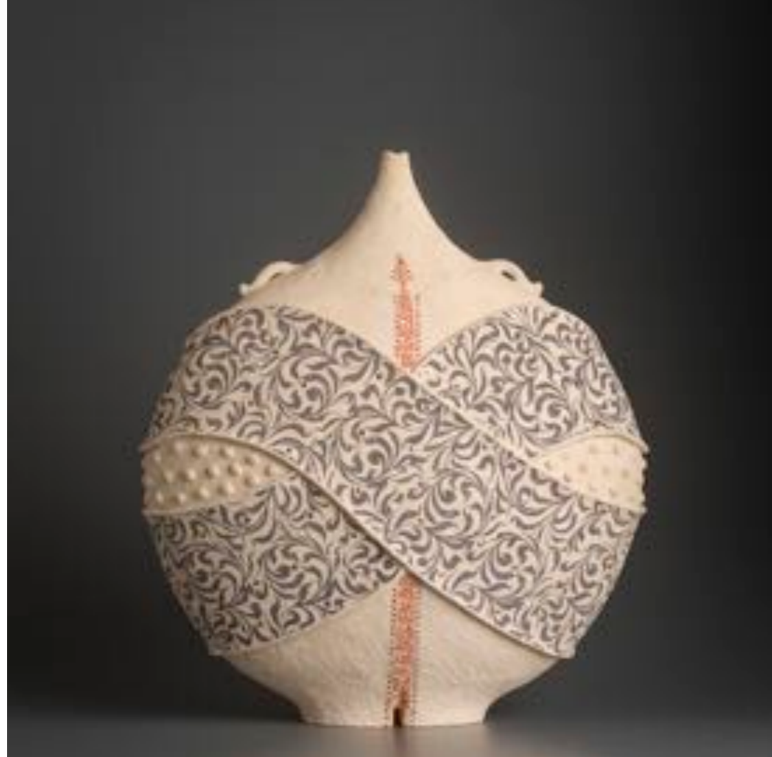
Agora VI 2017 44x39x18 cm

Sus piezas son fácilmente reconocibles, por los bordes deshilachados de las mitologías y el lenguaje, donde tiene lugar el diálogo y la fertilización cruzada entre culturas. Las experiencias personales de conflicto, migración, dislocación y renovación se cruzan con los dilemas entre tradiciones y modernidad.